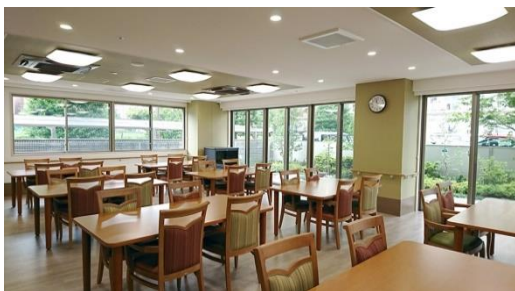
共用食堂(イメージ)

和食を中心に、管理栄養士監修の栄養バランスのとれた食事を 1 食からオーダーできます。