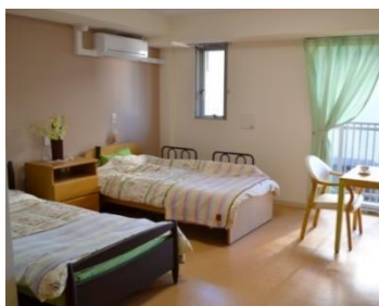
2 人用住戸(イメージ)