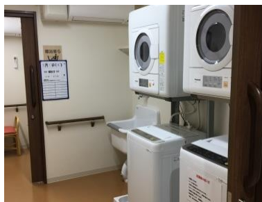
共用洗濯室(イメージ)

和食を中心に、管理栄養士監修の栄養バランスのとれた食事を 1 食からオーダーできます。